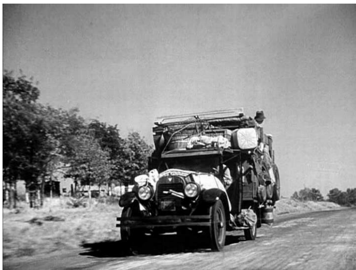
Familia de Okies huyendo en un Hudson Super Six Sedán de su Oklahoma natal y de la Dust Bowl que asoló aquellas tierras durante la Gran Depresión, fotograma de la película Las Uvas de la Ira , John Huston, 1940

My house on fire : where's that fire wagon now Ain't but the one thing : I don't want my garage to burn down I got a Hudson Super Six : I got me a little old Cadillac Eight I woke up this morning : my Cadillac standing at my back gate Hop on boys : I got the best chauffeur in town He said Hudson Super Six : my Cadillac didn't burn down Oh Lord Lord : wonder where is my chauffeur now Got my Cadillac Eight : done Cadillaced out of town I tell the whole round world : I ain't going to walk no more I got a Cadillac Eight : take me anywhere I want to go