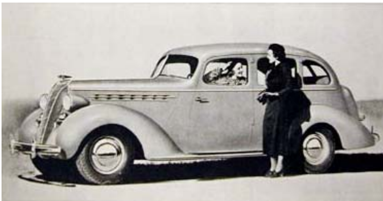
It's the 1936 Terraplane. Bringing Fine Quality to the Low Price Field. Así rezaba la publicidad de la época.

Está claro que Robert Johnson , en sus arrebatos de celos, gustaba de castigar a sus mujeres para demostrar que él era el mejor amante, como es este caso, donde vemos que, una vez realizadas a su coche-mujer todas las reparaciones que plantea, al final, cuando él gire la llave de contacto, las bujías de ella le darán fuego ( And when I mash down on your little starter : then your spark plug will give me fire ).