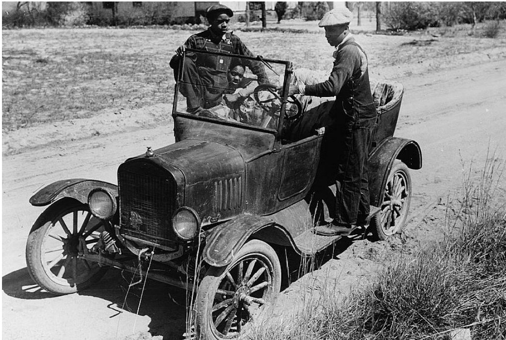
Negro youngsters and their Model T, near Pacolet, South Carolina, Jack Delano, March 1941

Well well when you see lindy women : I want you to throw your wives in the van Well well probably next spring : hey I'm going to rig up my T Model again Well well the T Model Ford : I say is the poor man's friend Well well it will get you there : hey well when your money is spent Well well one thing about the T Model : you don't have to shift no gears Well well just let down the brake and feed the gas : hey and the stuff is here Well well a V-Eight Ford : and it done took to style Well well they raised it all the way from ninety : hey down to a hundred miles Well well somebody : they done stole my wine on the road Well well it's find somebody : hey got a T Model Ford