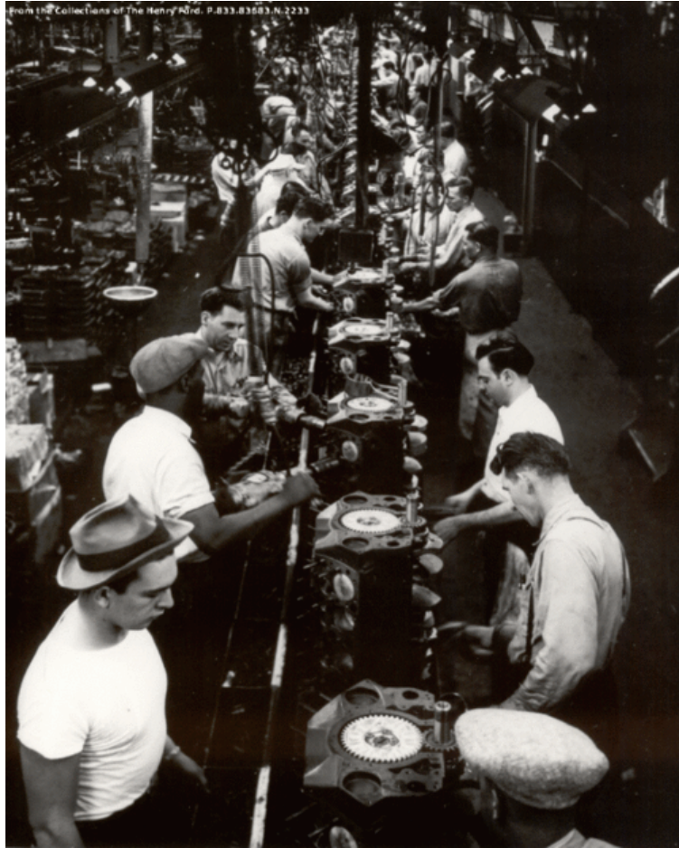
Trabajadores, blancos y negros, en un fábrica Ford, 1950

De esto mismo habla Blind Blake en la siguiente canción, de ir a Detroit en busca de un buen trabajo, si puede ser, donde Mr. Ford: