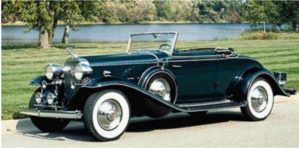
1932 Cadillac Eight convertible coupé

En los años 30, la fabricación de este modelo, el Cadillac Eight, supuso el culmen del coche como vehículo de lujo y refinamiento dentro de la gama deportiva (en otro escalón estarían los Rolls o los Lincoln). Ésta fue la principal baza de Cadillac, que siempre se sintió más a gusto fabricando buenos coches (entendiendo esto como caros y exclusivos) que abaratando costes y precios.