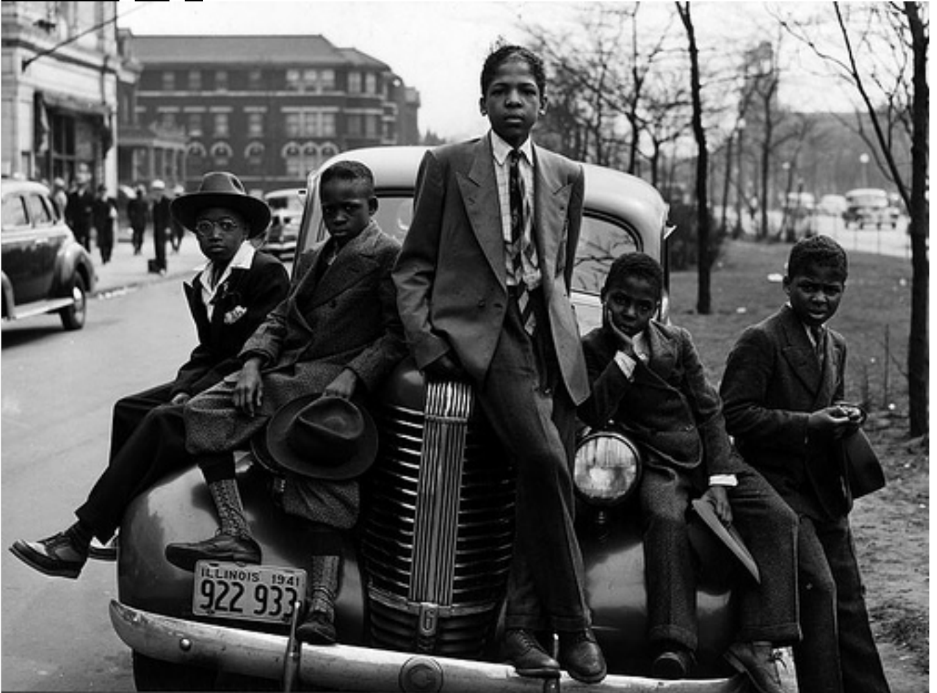
Black boys on Easter morning. Southside, Chicago, Illinois, April 1941