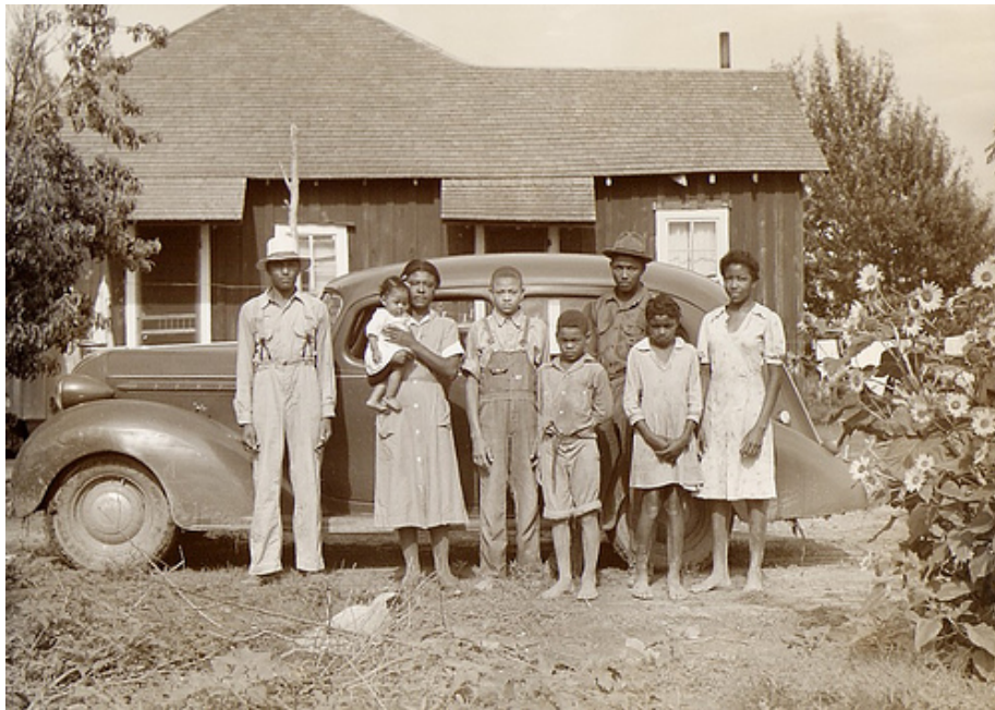
African-American family posing in front of their home (junto a lo que parece un Hudson Terraplane de los años 30)

Un vistazo a lo dicho en estas páginas, nos presenta una historia del automóvil que, tal y como la hemos vivido en nuestro país, puede hacernos pensar que, en la primera mitad del siglo XX, los propietarios de un coche se dividían en dos tipos: la familia acomodada, poseedora de un coche de lujo, que hacía gala y ostentación de éste (el típico analfabeto enriquecido con el estraperlo que se compraba un haiga: “el coche más grande que haiga”); o una familia modesta que con mucho esfuerzo y sacrificio, había juntando unos pocos ahorros para comprar un coche barato que ayudase a hacer más fácil trabajar y vivir en el campo. Si cerramos los ojos y trasladamos esta imagen al Viejo Sur, puede que se recreemos mentalmente una fotografía como la siguiente: