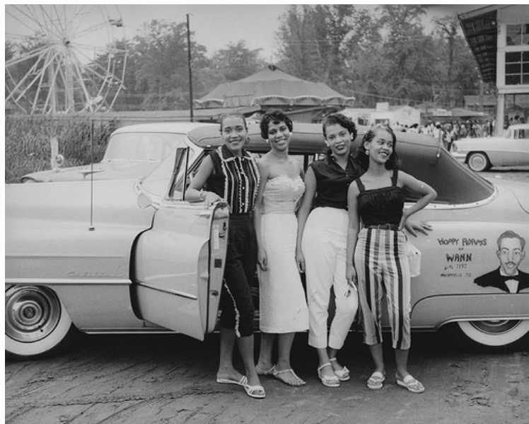
Four young African American women standing beside an automobile (a Cadillac), 1958