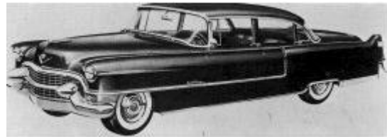
Cadillac Coupé De Ville 1955

En la canción, Chuck Berry compite en una carrera de coches callejera con otro tipo para reclamar las atenciones de una chica, al más puro estilo Rebelde Sin Causa . Chuck Berry conduce un Ford V-8 y el otro chico un Cadillac Coupé De Ville.