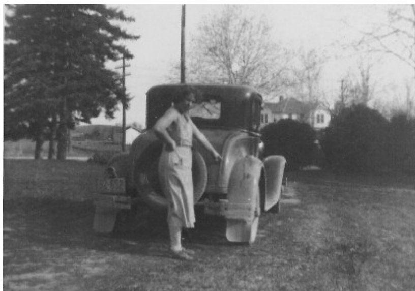
John Dillinger's 1930 A model Ford

Este coche se hizo especialmente conocido porque fue el que utilizó el famoso atracador de bancos John Dillinger, en gran parte de sus fechorías, apareciendo su fotografía en la prensa de todo Estados Unidos.